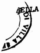
TABELLA 10 - (art.15 - comma 4 - Decr. Leg.vo 15.11.93 n. 507) -

Pubblicità mediante distribuzione di materiale pubblicitario, oppure persone circolanti con cartelli o altro: tariffa per ciascuna persona per ogni giorno o frazione.